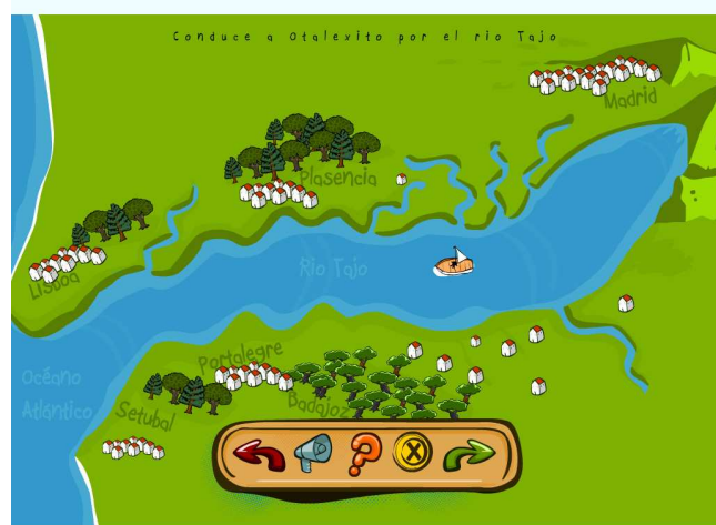
Uno de los juegos didácticos consistente en dirigir una barca por el río Tajo

Todos los juegos, con textos en ambos idiomas, imágenes en movimiento y sonido, estarán basados en los itinerarios curriculares oficiales de Primaria y ESO y han sido diseñados bajo la supervisión de un especialista en educación infantil.