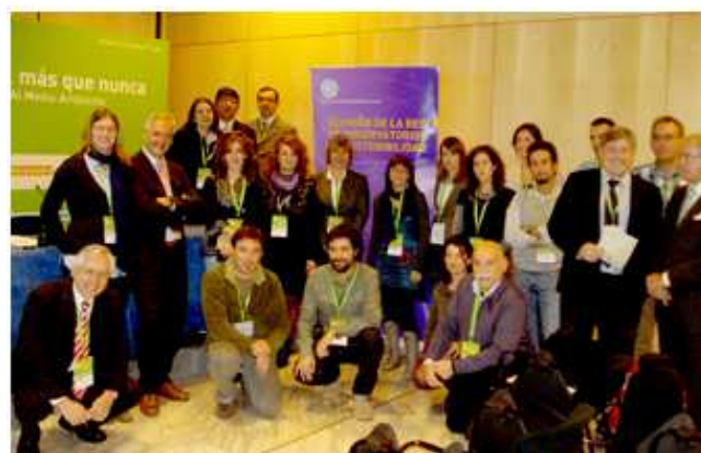
Asistentes a la reunión del 22 de noviembre de 2010 de la Red de Observatorios de Sostenibilidad.